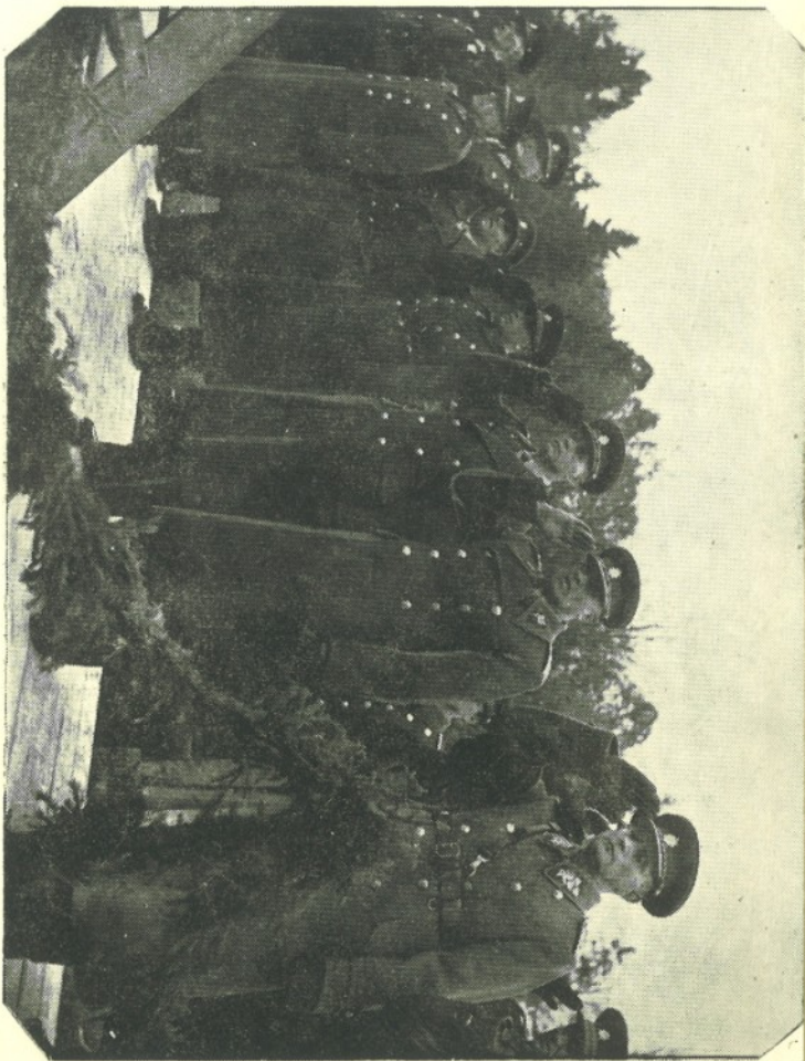
Slavnostní znovuotevření voj. akademie 20. října 1945.