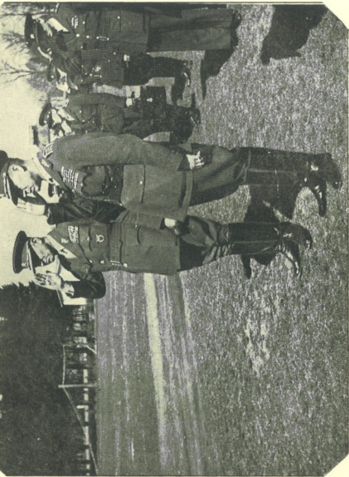
Ministr NO a náčelník hl. štábu návštěvou ve voj. akademii u příležitosti 1. výročí příjezdu p. presidenta Dr. E. Beneše do vlasti.